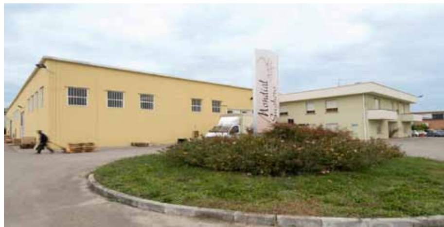
Vezzano sul Crostolo (RE), Italia

capacità produttiva di tappi da spumante